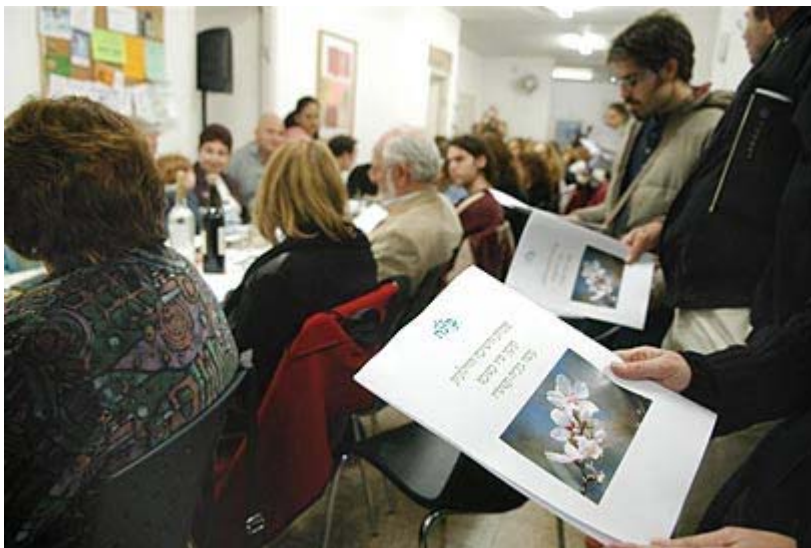
הישיבה פתחה את שעריה, היום

שרת החינוך, יולי תמיר, השתתפה בטקס חנוכת הישיבה, והבטיחה: "אפעל לקדם תקצוב ישיבות, גם לחילונים ולא רק לדתיים. אני שרת חינוך חילונית ולדעתי היהדות היא חלק בלתי נפרד מאיתנו... זה נושא קרוב ללבי. אני יהודיה חילונית ויש מקום בחברה הישראלית ובמערכת החינוך ללמוד ברוח זו".